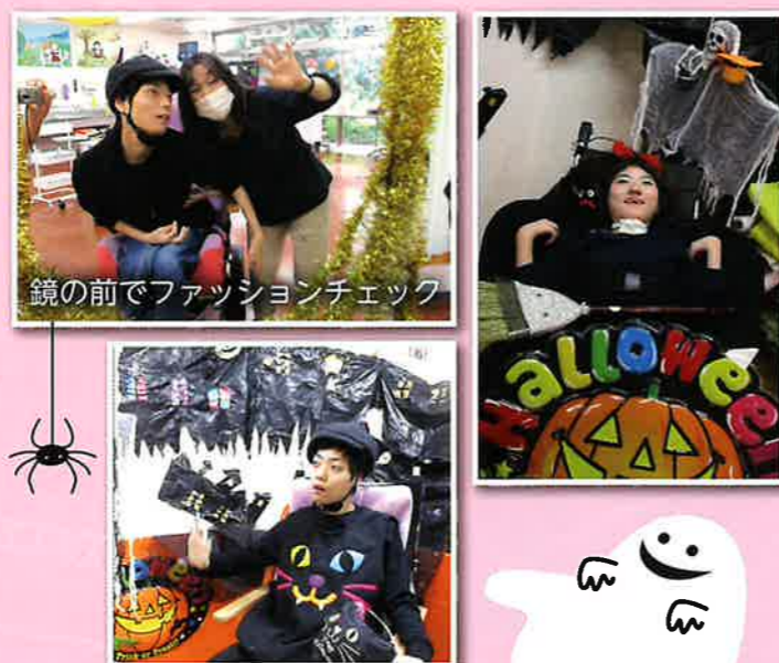
鏡の前でファッションチェック

10月25日～10月31日(土日を除く)に、障害者支援センター多機能型事業所の生活介護事業では毎年恒例の「ハロウィンを楽しむ」という活動を行いました。利用者の皆さんはとても素敵な衣装に仮装し、特設写真スポットで写真撮影をしたり、ファッションショーのランウェイのように皆さんの前を歩きお披露目しました。また、自宅から仮装をして、ハロウィンの雰囲気いっぱいふりまいて来所する方もいたり、とても盛り上がる活動でした。