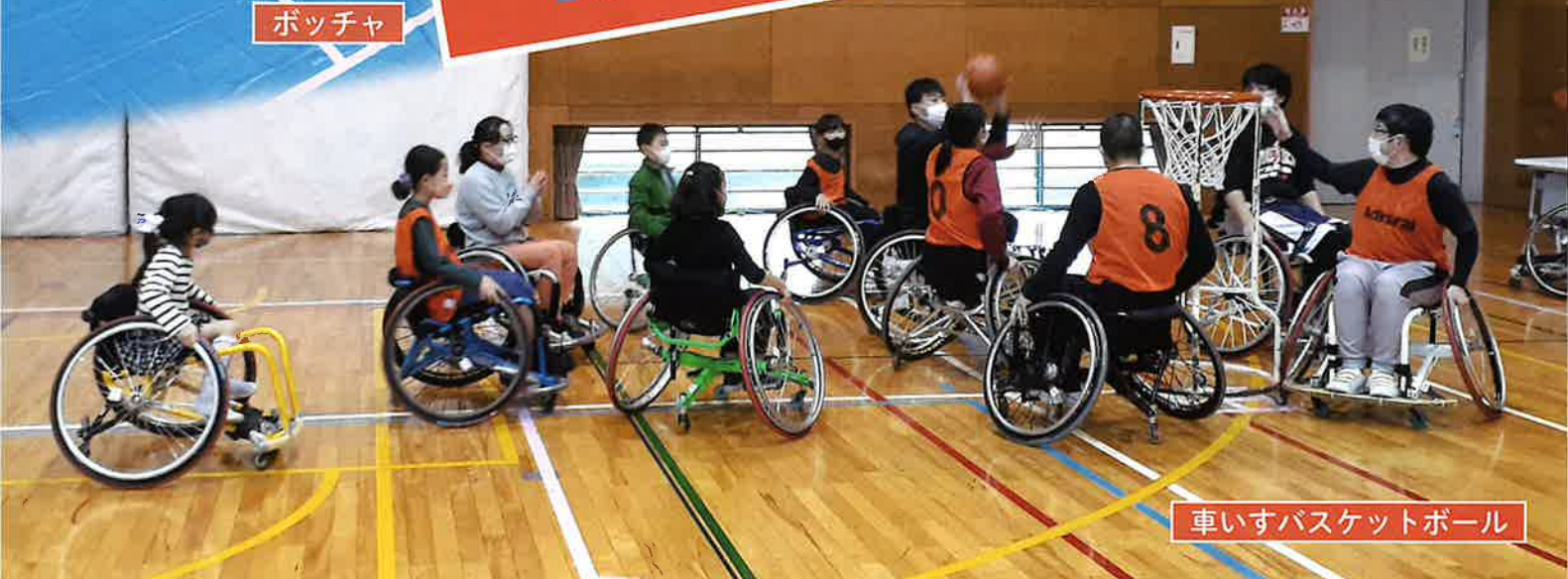
車いすバスケットボール