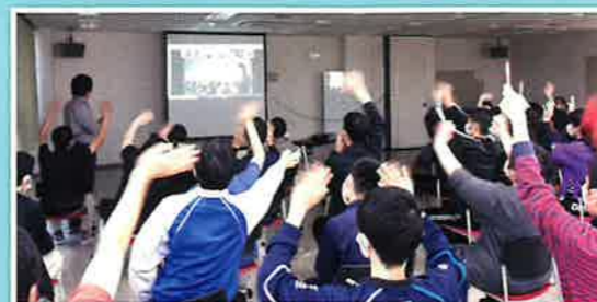
▲視聴ルームは笑顔で一杯です

よさこいや手話ソング、ダンス、楽器の演奏等、全6組の出演者による熱い思いの伝わるパフォーマンスが披露されました。視聴ルームを設け、画面越しでも一緒に手拍子をしたり、踊ったりと大盛り上がりでした!! 次回は、是非直接集まって、皆さんと一緒に盛り上げたいですね!!