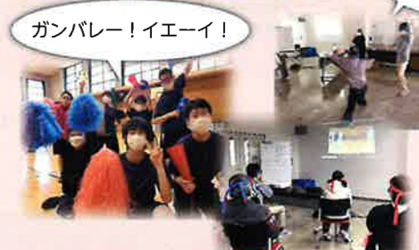
ガンバレー! イエーイ!