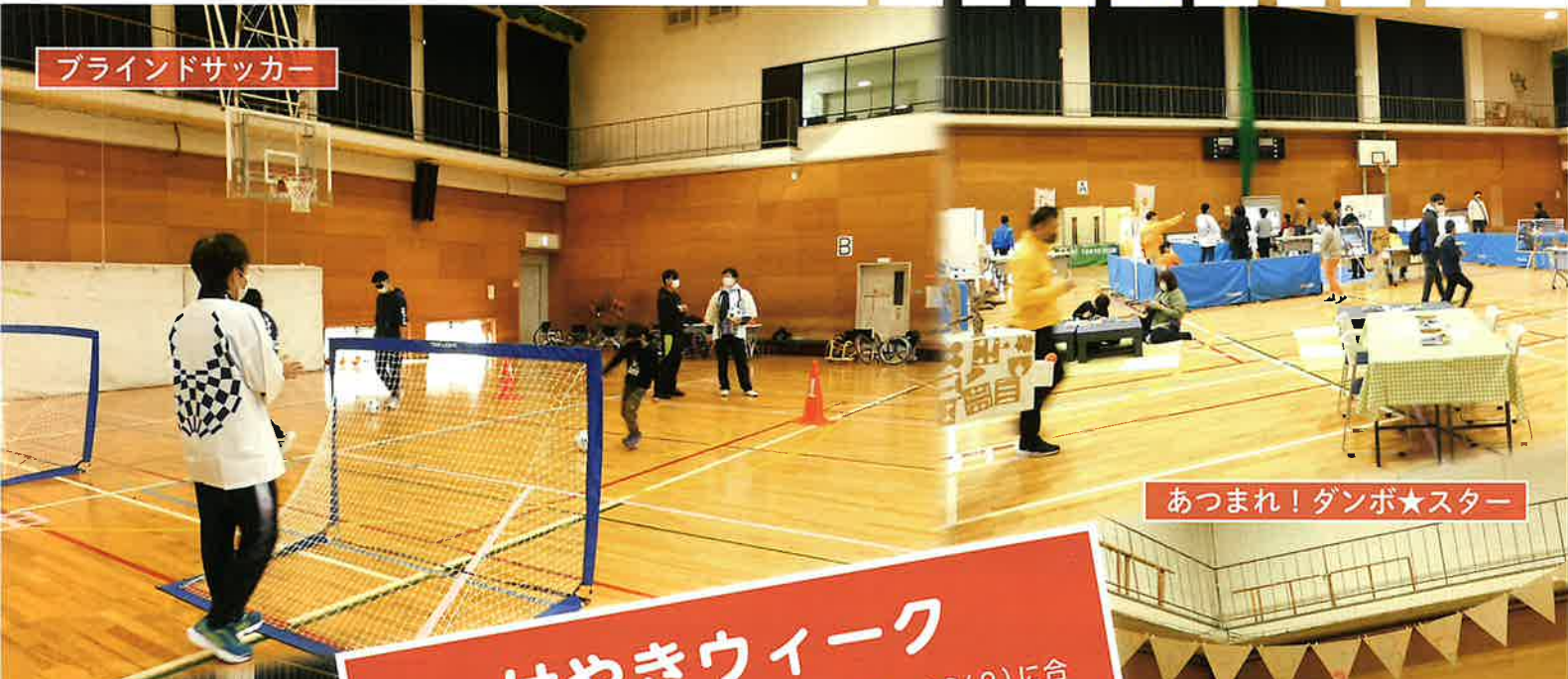
あつまれ！ダンゴ★スター