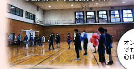
オンラインでも応援する心はとどく!