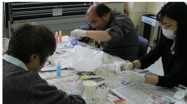
【昨年度に実施した「まつカフェ」の様子】

○申込: 各実施日の1週間前(原則)までに直接松が丘園へ *実施内容については、参加者の状況等により、予告なく変更する場合があります。