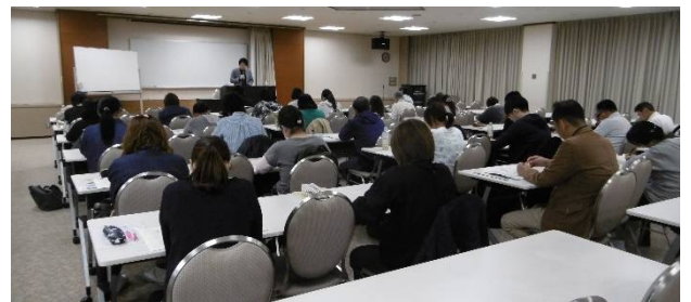
【 5/9 障害福祉制度の基礎の様子 】