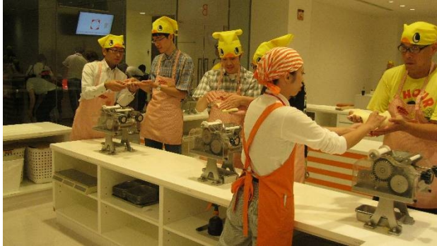
【 昨年度の外出企画(カップヌードルミュージアム)での様子 】