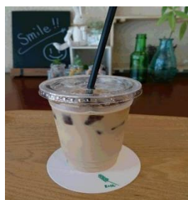
【これからの季節にピッタリ】

今年も夏季限定の特別メニューの季節がやってきました。氷コーヒーにたっぷりのミルクが入った冷たいドリンク「クラッシュ・オレ」です。