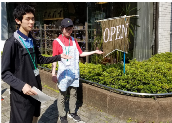
【暑い中チラシ配布を頑張りました】

当日は、2名の利用者の方と2名の職員が、ハンドメイドショップバオバブ(福祉ショップ)の販売のお手伝いや自主製品紹介のチラシ配布等を行いました。