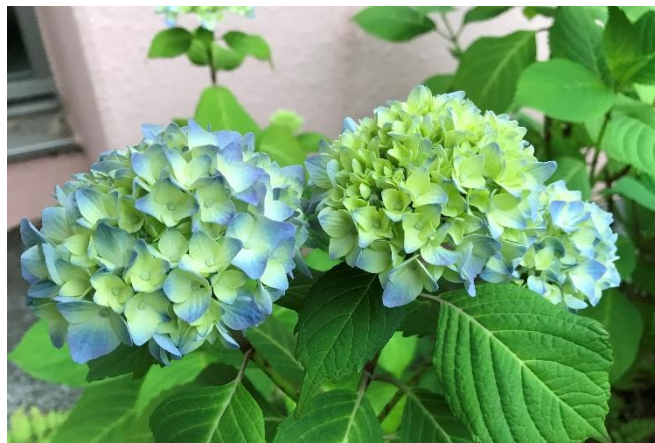
【 アジサイの花が色づき始めました(松が丘園)・5/18 】

今後とも、障害者自立支援協議会へのご理解・ご協力のほど、どうぞよろしくお願いいたします。