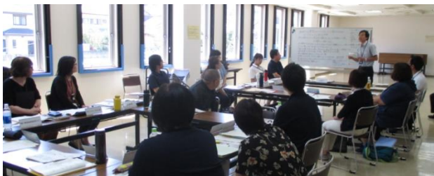
【 令和元年度に実施した部会(対面方式)の様子 】

この場をお借りしまして、委員として携わっていただきました皆様には感謝申し上げます。ありがとうございました。