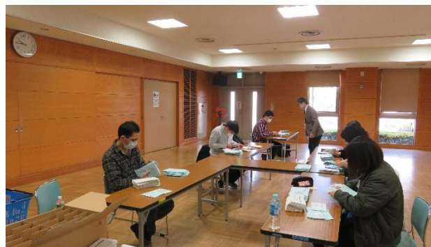
【 会社体験(就労準備プログラム)の様子 】

今後、該当する方に向けて、順次案内を送付いたしますので、多くの方の参加をお待ちしています。