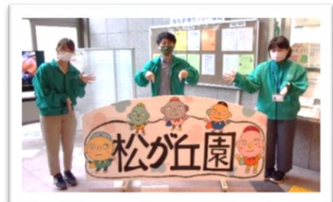
【 記念ボードの前で「ハイ、ポーズ！」 】

松が丘園の1階ホールには記念ボードを設置しました。今回の園祭で缶バッジにもなったキャラクターが描かれた記念ボードは、カラフルかつポップな仕上がりで、今年の園祭に花を添えてくれました。