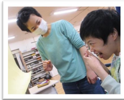
【 どこに植えるか検討中です 】