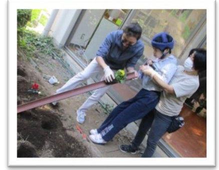
【 さあ本番。早くきれい花が咲かないかな 】