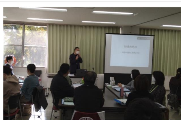
【 皆さん集中して講師の話をお聴きしています 】

今後もこうした研修の開催を通じて、市内福祉サービス事業所の人材育成に貢献していきます。