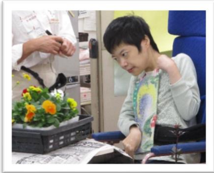
【 どの花を植えようかなあ 】

11月上旬に園芸活動としてケアルーム前の花壇に花を植えました。今後の花の成長が楽しみです。