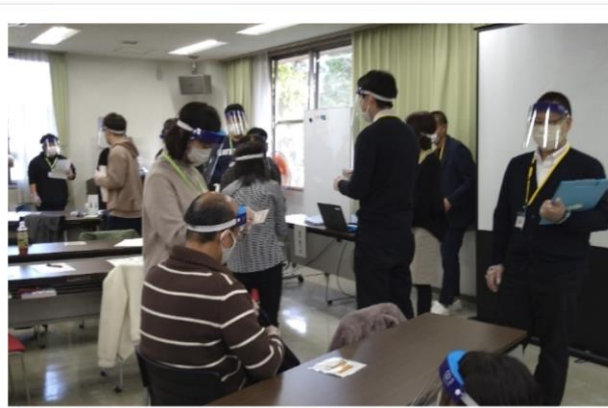
【 「支援手順書に基づいた支援」の演習 】