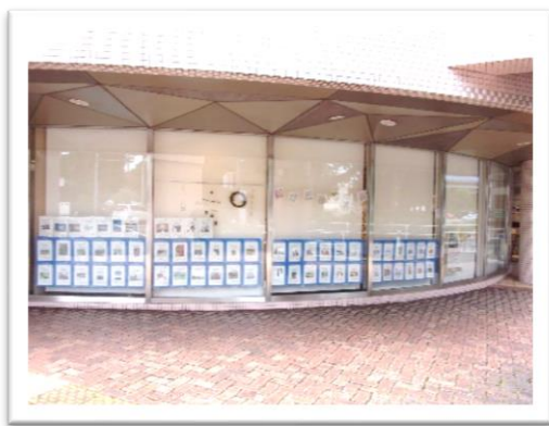
【 作品展示で「麦の穂」が賑やかに 】

「季節の風景」をテーマとして募集し、たくさんの方に応募していただいた写真を、松が丘園の1階にあるカフェ「麦の穂」に展示しました。作品が展示されたことでいつにもまして賑やかになり、バス待ちをしていた方も興味深そうに見ていました。