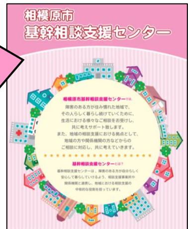
▲平成24年に設置されました

この検討結果を受けて、相模原市により平成24年4月に基幹相談支援センターが、同年10月に南障害者相談支援キーテーションが設置されました。