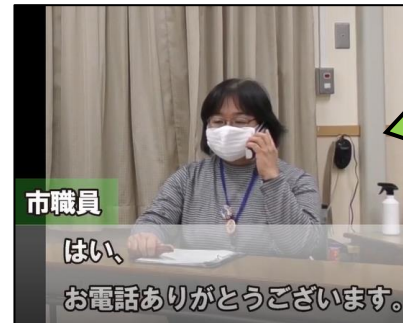
▲支援者の対応場面の寸劇を収録