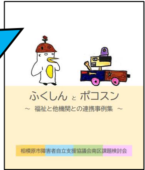
▲イラストで事例紹介

支援につながる事が困難な状況にいる障害者や支援が途切れてしまった障害者を関係する機関につなげるにはどうしたら良いかと検討する中で生まれた事例集です。