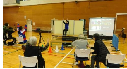
令和3年度実施の講座の様子

日 時 令和4年6月22日、7月20日、9月21日、10月26日、11月9日、 12月14日、令和5年1月25日 各水曜日 10時～11時（全7回）