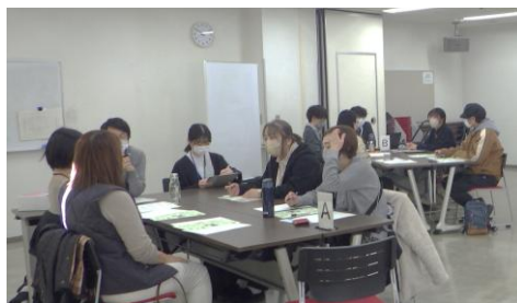
相談支援専門員オープンデスク 大盛況でした 🎉