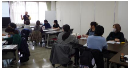
部会員による出張型虐待防止研修の様子です☆