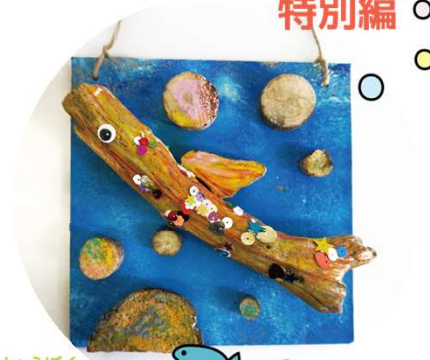
りゅうぼく 流木で おさかなをつくろう!

「ふらっとアート」は、ボランティアの方と一緒に工作をしたり、絵を描いたり…創作活動を楽しむ日です。 けやき体育館に展示する作品と一緒に作りましょう！今回はアートラボはしもと特別編！流木でおさかなを作ります。色々な大きさや形の流木に色をつけたり、ビーズ等で飾りをつけて世界に一つだけのオリジナルのおさかなを完成させよう！元気いっぱいのおさかなをけやき体育館に泳がせてね♪ 時間内であればいつ来ても、いつ帰っても大丈夫！その日の気分で気軽に遊びに来てください。